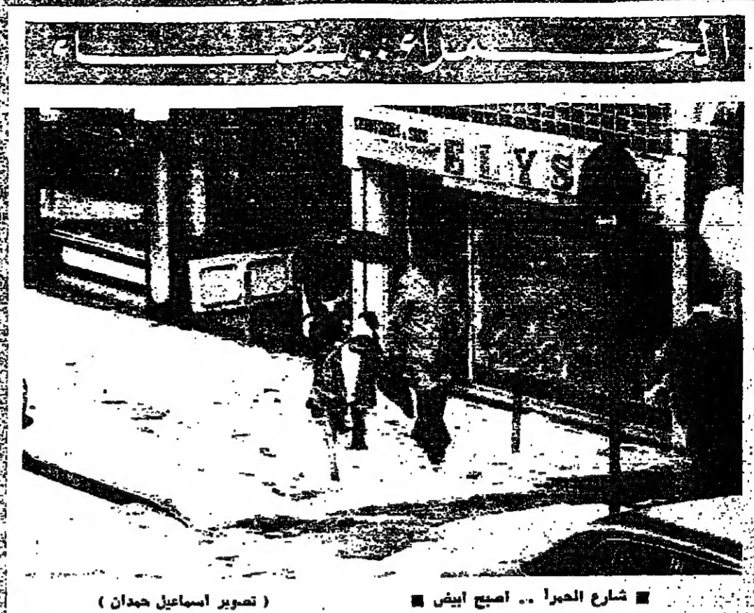
شارع الحريرة - أصبح ابيض